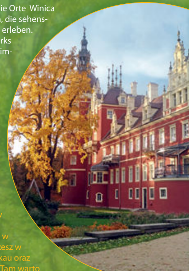
Fürst-Pückler-Schloss Bad Muskau Pałac Księcia Pücklera w Bad Muskau

Chciałbyś zobaczyć „odcisk stopy” lodowca, podziwiać bajkowy pałac lub zwiedzić wielowiekowe kościoły Euroregionu Sprewa-Nysa-Bóbr? W takim razie pobierz trasę GPS „Parki i kościoły” na smartfona. Trasa liczy 121 km i wiedzie między innymi przez transgraniczny Geopark Łuk Mużakowa, który powstał w epoce lodowcowej. Odpocząć możesz w Pałacu księcia Pücklera w Bad Muskau oraz w miejscowości Niwica i Gorzupia. Tam warto również zobaczyć cenne wnętrza świątyni. Ostatni przystanek trasy GPS „Parki i kościoły” stanowi Kościół Wniebowzięcia NMP w Nowogrodzie Bobrzańskim. Te i inne trasy można bezpłatnie pobrać ze strony www.spreewald.de .