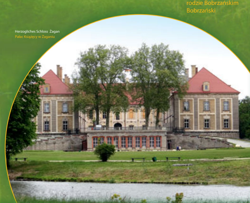
Herzogliches Schloss Żagan Pałac Książęcy w Żaganu

Realisation und Redaktion / Realizacja i redakcja: Tourist-Information Raddusch in der Spree-Neiße-Bober-Region Konzept und Layout / Konceptcja i layout: molier medien agentur gmbh