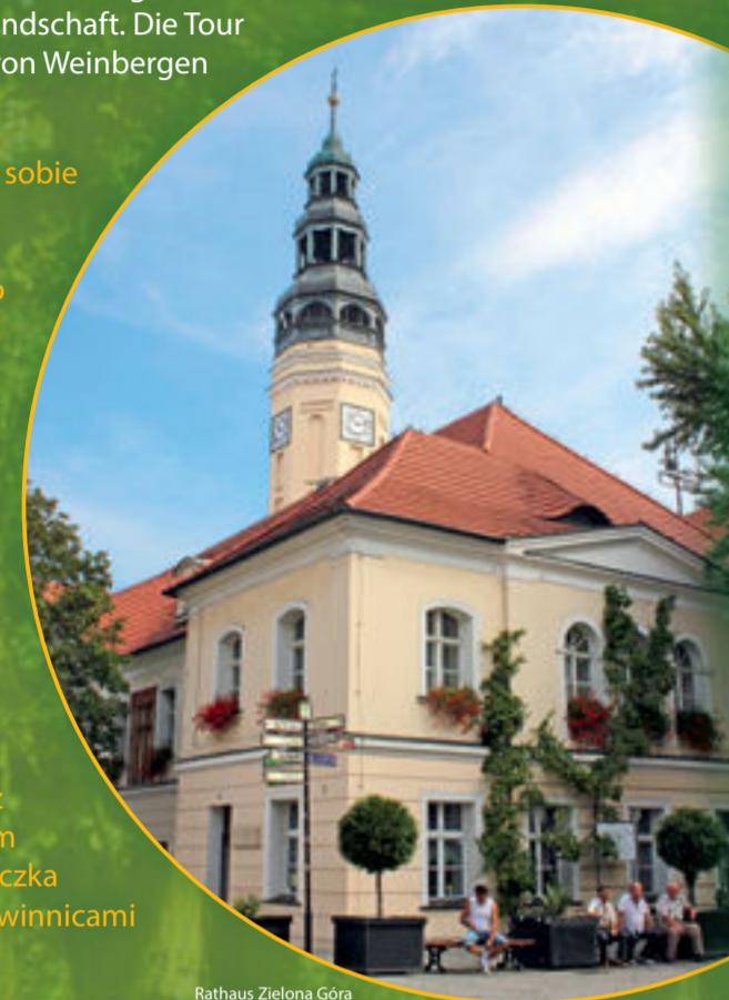
Rathaus Zielona Góra Ratusz w Zielonej Górze

Lubisz jeździć rowerem i masz przy sobie zawsze smartfona? W takim razie całkowicie spełniasz warunki do odbycia wycieczki przyrodniczej po Euroregionie Sprewa-Nysa-Bóbr! Pobierz bezpłatnie nową trasę GPS „Rzeki i krajobrazy” i wybierz się na przygodę. Wycieczka rozpoczyna się w Burgu w Szprewaldzie. Odkryj największą osadę Niemiec z rozproszoną zabudową i niepowtarzalny labirynt wodny Szprewaldu. Następnie poznaj krajobrazy naznaczone w przeszłości odkrywkami węgla brunatnego, dziś odzyskane ponownie przez naturę. Przepraw się promem przez Odrę i naciesz oko niepowtarzalnym krajobrazem rzecznej doliny. Wycieczka kończy się po 166 km w otoczonej winnicami Zielonej Górze.