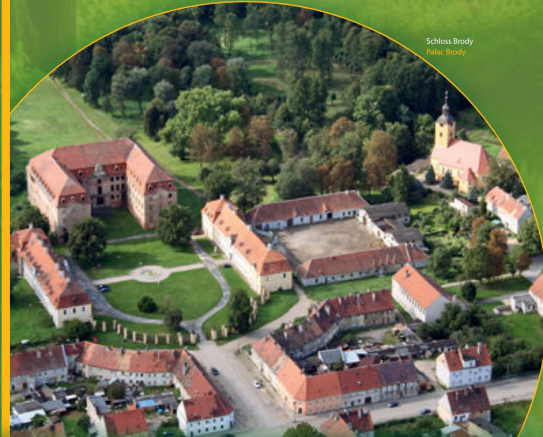
Schloss Brody Pałac Brody