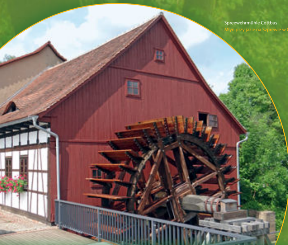
Spreewehrmühle Cottbus Młyn przy jazie na Szprewie w Cottbus